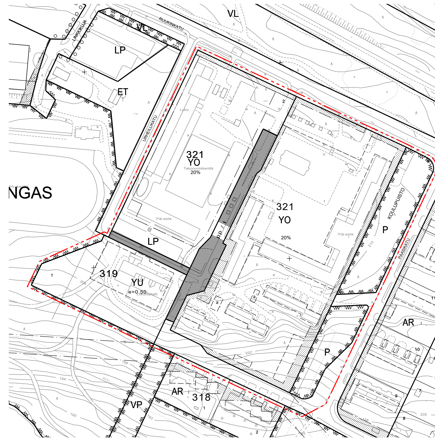
OTE VOIMASSA OLEVASTA ASEMAKAAVASTA, JOTA MUUTETAAN 1:2000